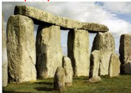
چرا این سنگ‌ها مقدس بشمار می‌آیند؟

براستی چرا مکانها یا اشیاء خاصی مقدس می‌شوند و چگونه است که این تقدس از طریق هنر و معماری نمایان می‌شود؟